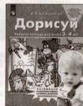
Дорисуй. Рабочая тетрадь для детей 3–4 лет