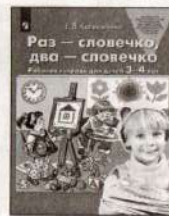
Раз — словечко, два — словечко. Рабочая тетрадь для детей 3–4 лет