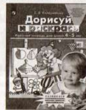
Дорисуй и раскрась. Рабочая тетрадь для детей 4–5 лет