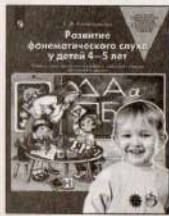
Развитие фонематического слуха у детей 4–5 лет. Учебно-методическое пособие