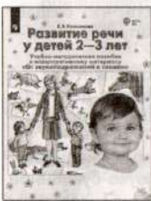
Развитие речи у детей 2–3 лет. Учебно-методическое пособие к иллюстративному материалу «От звукоподражаний к словам»