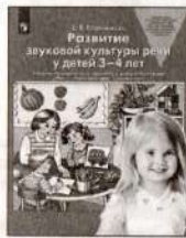
Развитие звуковой культуры речи у детей 3–4 лет. Учебно-методическое пособие