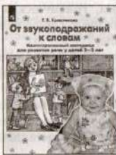
От звукоподражаний к словам. Иллюстративный материал для развития речи у детей 2–3 лет