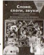
Слова, слоги, звуки. Демонстрационный материал для занятий с детьми 4–5 лет