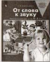
От слова к звуку. Рабочая тетрадь для детей 4–5 лет