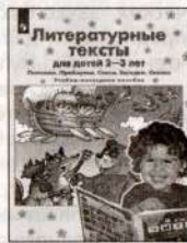
Литературные тексты для детей 2–3 лет. Учебно-наглядное пособие